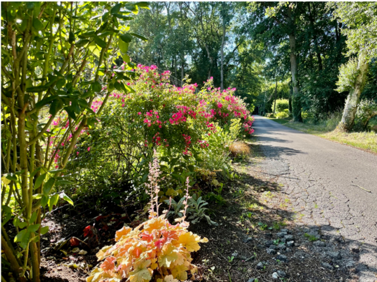
Exemple de végétalisation des trottoirs au Bois de Cise

NB : Le permis de végétaliser façades et pieds de murs face à la rue est une autorisation d'occupation temporaire du domaine public. Elle ne pourra être accordée qu'aux personnes qui s'engagent à respecter une charte de végétalisation garantissant le cadre et la réussite de leur projet.