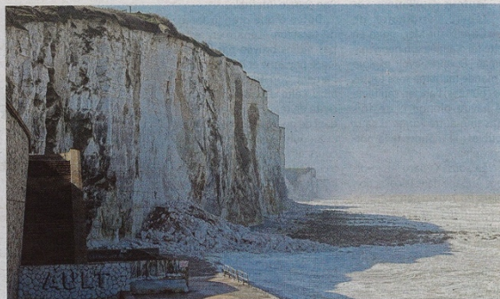
Le littoral Aultois, avec ses emblématiques falaises, est tout à la fois la plus grande force de la commune et son plus grand défi. Illustration - image d'archive

L'édile ajoute même une quatrième piste potentielle: