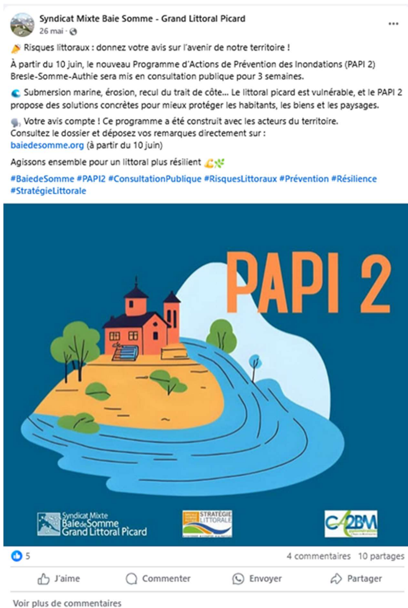
Figure 2 : Publication Facebook du 26 mai 2025 par le SMBS-GLP